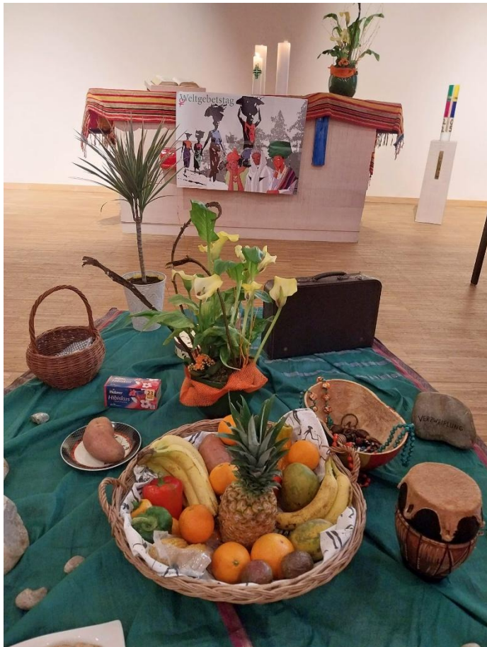
Foto vom Weltgebetstag am 6. März 2026